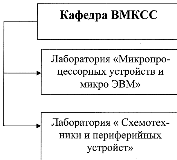
Схема организационной структуры кафедры